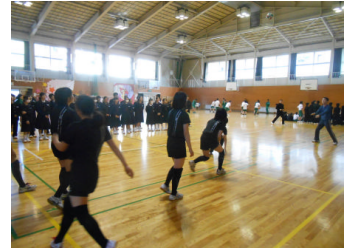
レシーブをするバレー部