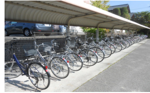
自転車置き場の様子