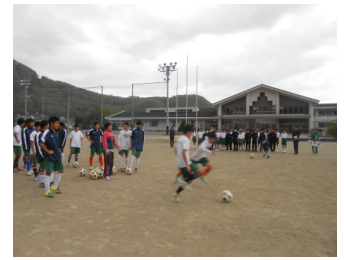
競り合うサッカー部員