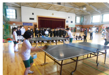
スマッシュを決める卓球部