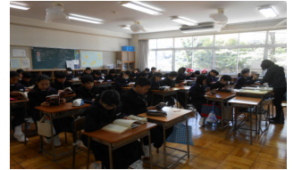
静かな1年生朝読書

どの学年も楽しそうに、そして一生懸命な学習・生活の様子がうかがえました。また、授業参観では多数の保護者の皆様の参観で生徒も張り切っていました。学習に部活動に意欲的な4月がスタートしています。全校生徒292名が揃い、学校が一段と活性化し、わくわくしている姿が印象的でした。