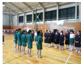
部紹介の説明をする先輩