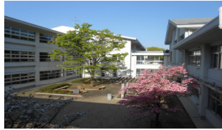
ハナミズキ咲く中庭