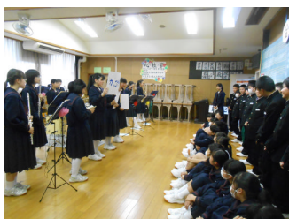
楽しく紹介する吹奏楽部