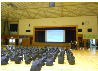
生徒会による新入生歓迎会