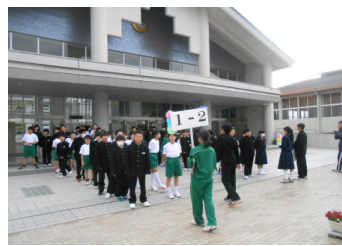
部活動見学へ誘導する本部