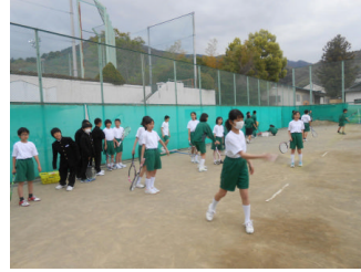
テニス体験をする1年生